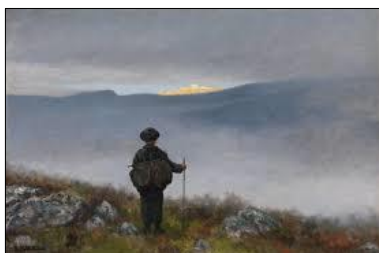
Theodor Kittelsen, Soria Moria slott